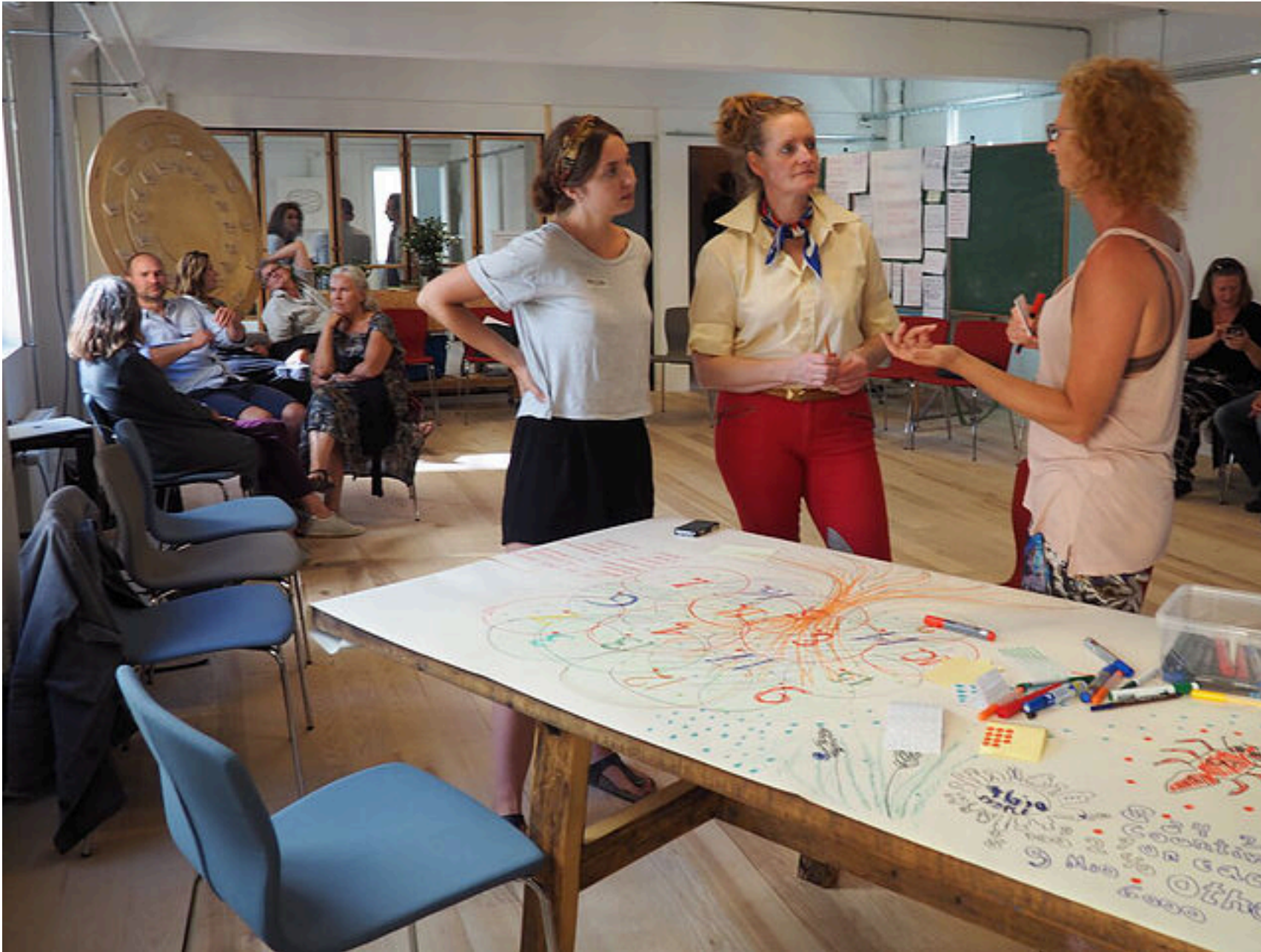
Borgerdag hos Chora Connection, den 16. september 2016, om FN's 17 verdensmål for bæredygtighed. Deltagere gav mangfoldige visionære udtryk for både problemerne, smerten og galskaben ved u-bæredygtigheden og for den livsudfoldelse, der kan finde sted, hvis vi formår at passe på vores blå planet i tide.