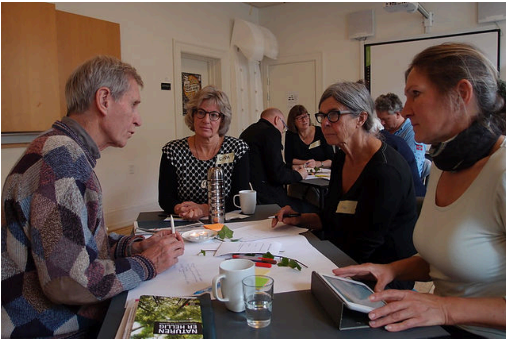
Fra den første Borgerdag på Amager, den 21. oktober 2015, hvor vi bl.a. stillede spørgsmålet: Hvilke tre ting vil du gerne undvære til gavn for klimaet?